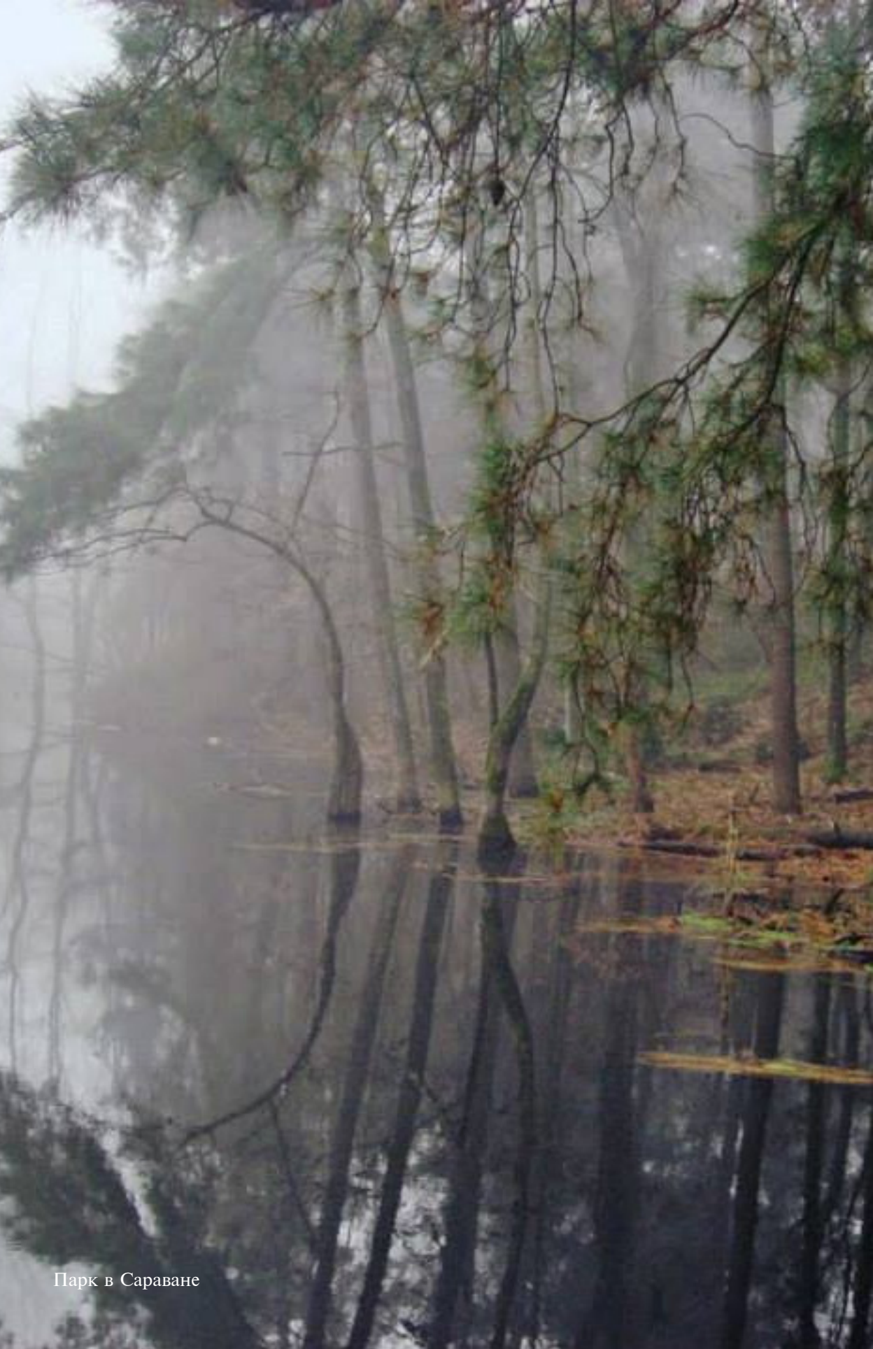
Парк в Сараване