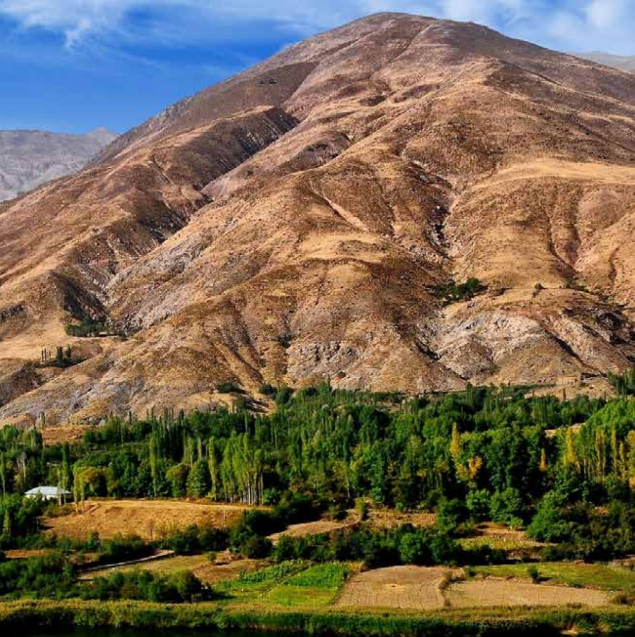
Озеро Ован. Провинция Казвин.