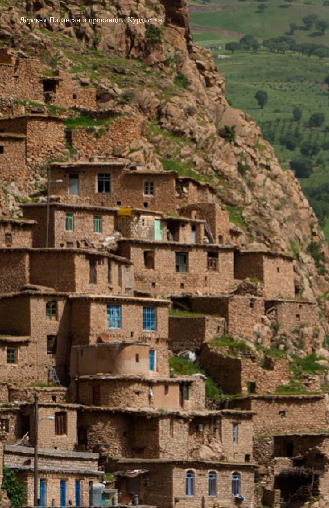
Деревня Паланган в провинции Курдистан